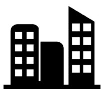
Edifícios comerciais e residenciais