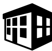
Salas comerciais / escritórios