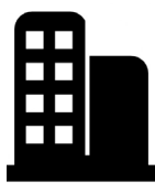
Entradas de apartamento